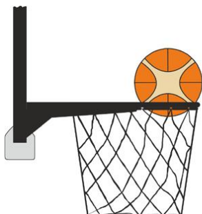
Figure 4 : Ballon à l'intérieur du panier

Il y a violation pour intervention illégale si un joueur défenseur touche le ballon quand il est à l'intérieur du panier.