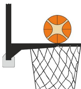
Figure 3 : Ballon en contact avec l'anneau

C'est une intervention illégale pour un joueur défenseur ou attaquant si, lors d'un tir au panier, ce joueur touche le panier (l'anneau ou le filet) ou le panneau alors que le ballon est en contact avec l'anneau et qu'il a encore une chance de pénétrer dans le panier.