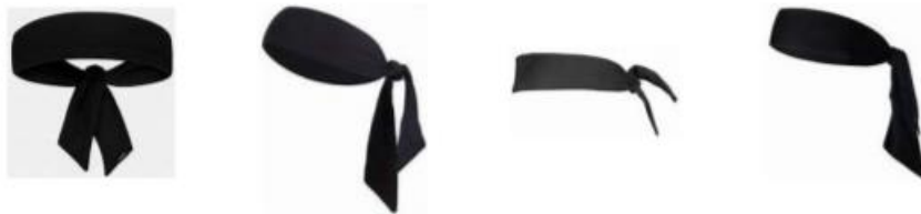
Figure 1 : Bandeau de tête de type bandana

Le port de bandeau de tête de type bandana (bandeau noué) n'est pas autorisé